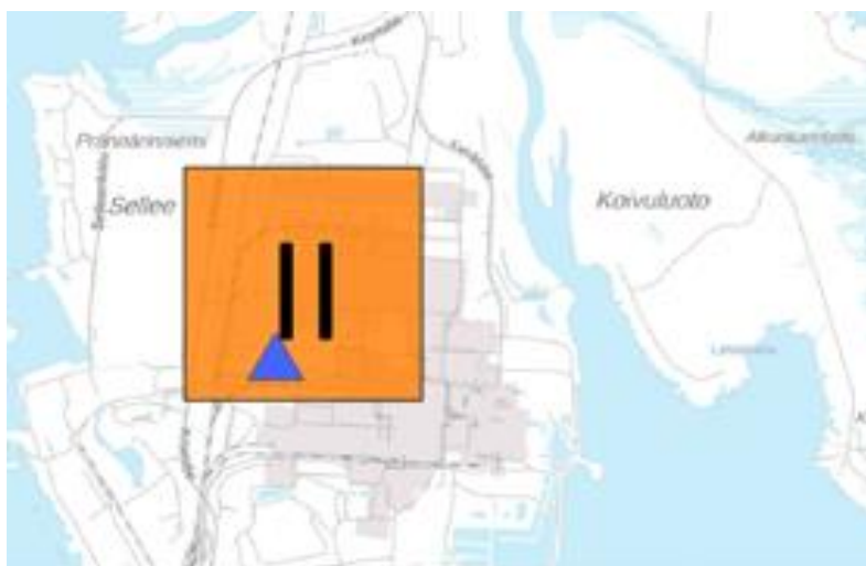
Kárta 2: II- riskaguovllu čuolbmaruvtto Durdnosa Röyttäs. Riskaruvttos leat leamaš 2019–2022 unnimustá 4 alárbmabarggu.