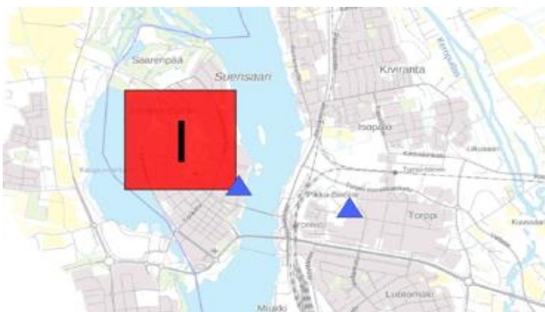
Kárta 1: I-riskaguovllu čuolbmaruvttot Roavvenjárgga Viirinkangasis ja Durdnosa Suensaaris. Riskaruvttuin leat leamaš 2019–2022 unnimustá 4 alárbmabarggu.