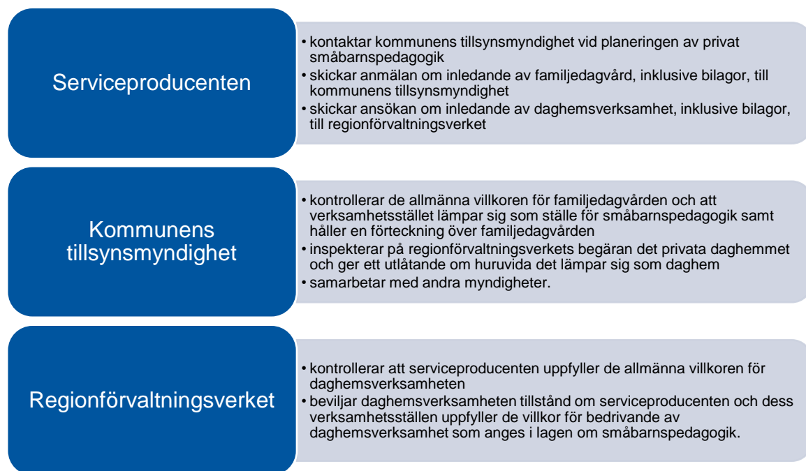
Figur 3: Anmälnings- och tillståndsförfarande för serviceproducenter av privat småbarnspedagogik.