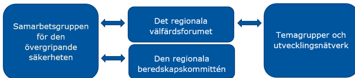
Bild 2 Organiseringen av samarbetet inom den totala säkerheten Regionförvaltningsverket i Västra och Inre Finland

Syftet med samarbetet inom den övergripande säkerheten är att få säkerhets- och välfärdsaktörerna att eftersträva en gemensamt uppfattad målbild, dvs. övergripande säkerhet. På det sätt som presenteras i bild 2 består samarbetsgruppens självständiga verksamhet av aktörer som fokuserar på teman inom hälsa och välfärd i skydd av det så kallade regionala välfärdsforumets åtgärder samt av den regionala beredskapskommitténs verksamhet som behandlar beredskaps- och beredskapsfrågor. Dessutom har det under det regionala välfärdsforumet organiserats temagrupper och nätverk som genomför det övergripande säkerhetsarbetet som en del av sin verksamhet.